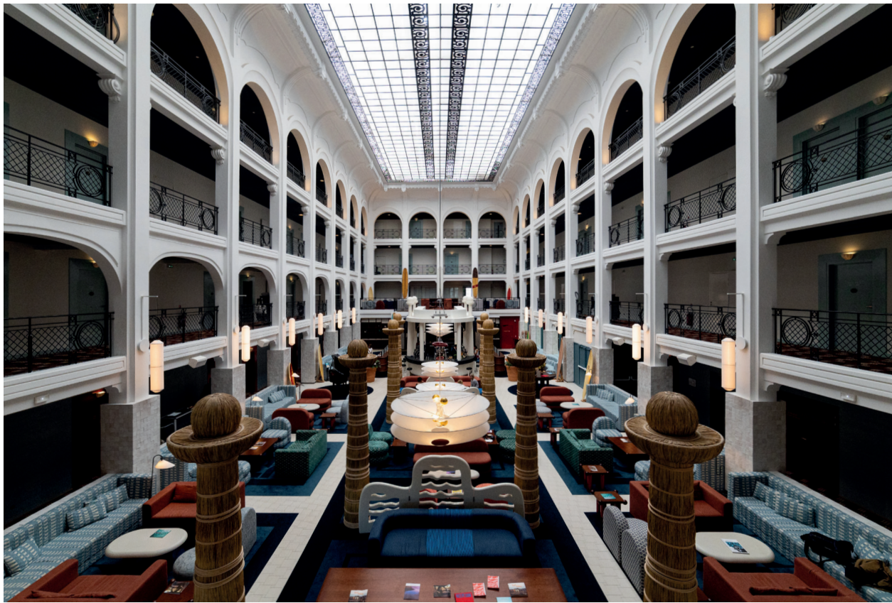
L'atrium du Regina Experimental Biarritz

Lors d'un week-end unique en son genre, venez vous former aux questions juridiques liées aux activités nautiques de bord de mer en forte expansion depuis plus de trente ans. DANS LE CADRE EXCEPTIONNEL DU REGINA EXPERIMENTAL BIARRITZ.